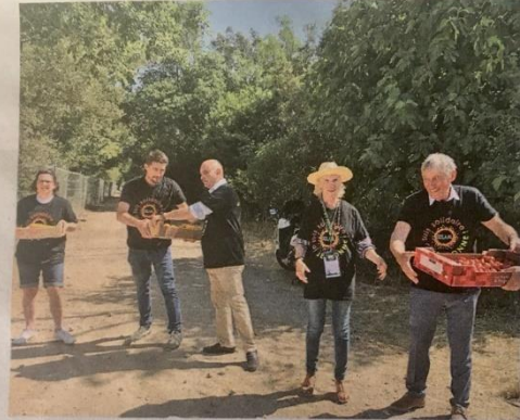
Le don agricole était aussi à l'honneur sur le salon, grâce à Solaal Sud. Une chaîne et collecte de 202 kg de fruits, légumes, plantes aromatiques, produits à base de safran, soupe de potimarron et bouquets d'aulx a été récupérée par l'association 'vendredi 13'. Tous ces produits ont bénéficié à 300 étudiants, au local Plombières et au local Campus de Luminy.